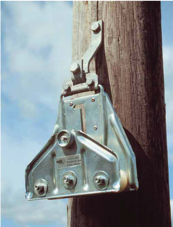
Linavn för luftopto.

Linavnen speciellt framtagen för optokabeldragning. vagnen är mycket skonsam mot kabeln. På raksträckor monteras vagnen direkt i kabelfästet. Rullarna är tillverkade av nylon och kullagrade.