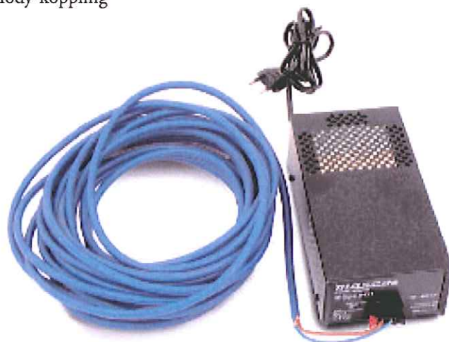
24 DC Volts Aggregat